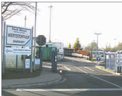
Einfahrt zum Wertstoffhof, Große Heide 50

Größere Mengen Restmüll und Sperrmüll sind direkt auf der Deponie in Hille zu entsorgen (siehe rechts).